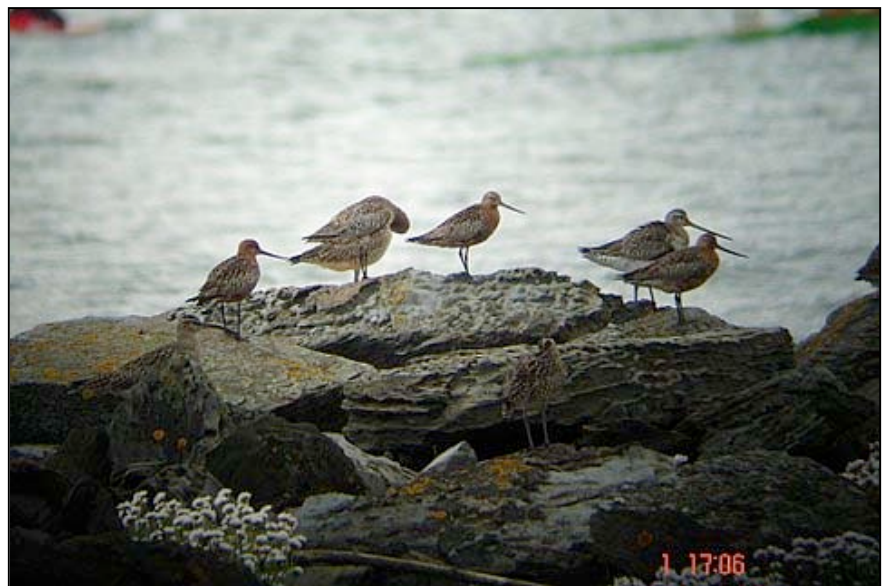
Agujas en la zona de la escollera

sumamente competitivo en el que más de uno vendió una xostrá (la hembra del jilguero, incapaz, contra lo imaginable por comparación con los humanos, de encadenar más de dos píos seguidos) a precio de excelente jilguero cantor; el Zorzal Común ( malvís ) que suele verse por la zona de la pista que la gente utiliza para pasear; el Pito Real ( picatoro ; el pájaro carpintero de color verde); la Tarbilla común (el char-char , denominado así en esta comarca por su peculiar