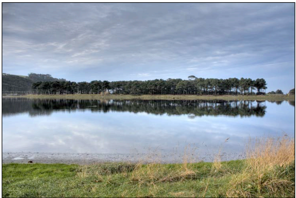
El “teatro de operaciones” de los protagonistas de este escrito

Ello ocurría en una tarde de finales de Mayo, en uno de esos días ya muy largos y en los que, después de una jornada lluviosa, a última hora luce el sol. Con la atmósfera clara, despejada por los vientos de la borrasca, la marea en pleamar (es sólo una apreciación subjetiva; la bajamar me transmite sensación de tristeza- el cuadro que se ofrecía ante mí era impresionante (y mira que